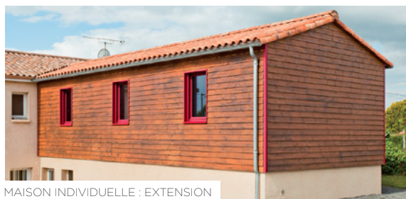
MAISON INDIVIDUELLE : EXTENSION