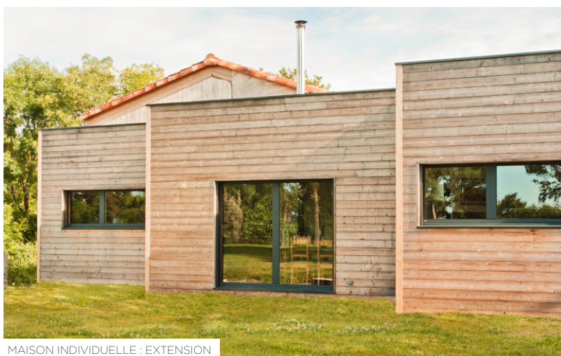
MAISON INDIVIDUELLE : EXTENSION