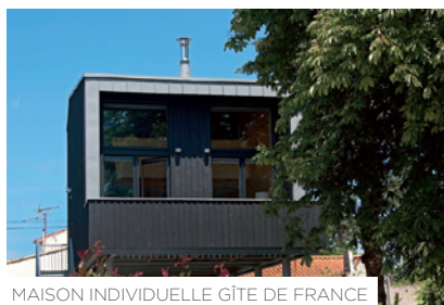
MAISON INDIVIDUELLE GÎTE DE FRANCE