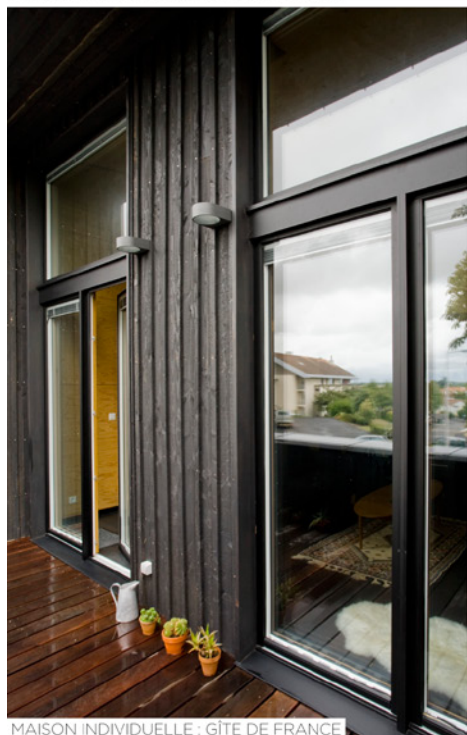
MAISON INDIVIDUELLE : GÎTE DE FRANCE