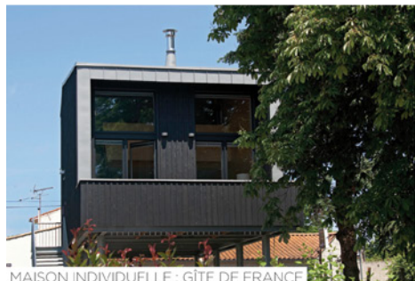
MAISON INDIVIDUELLE : GÎTE DE FRANCE