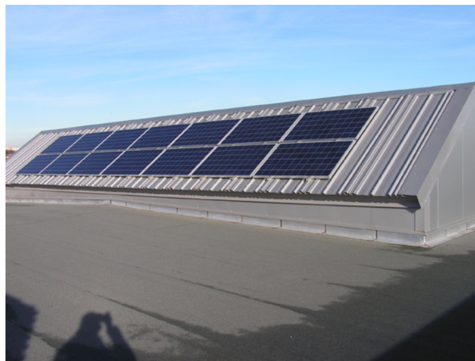
KOMET, solution solaire ultra simple, performante et modulaire