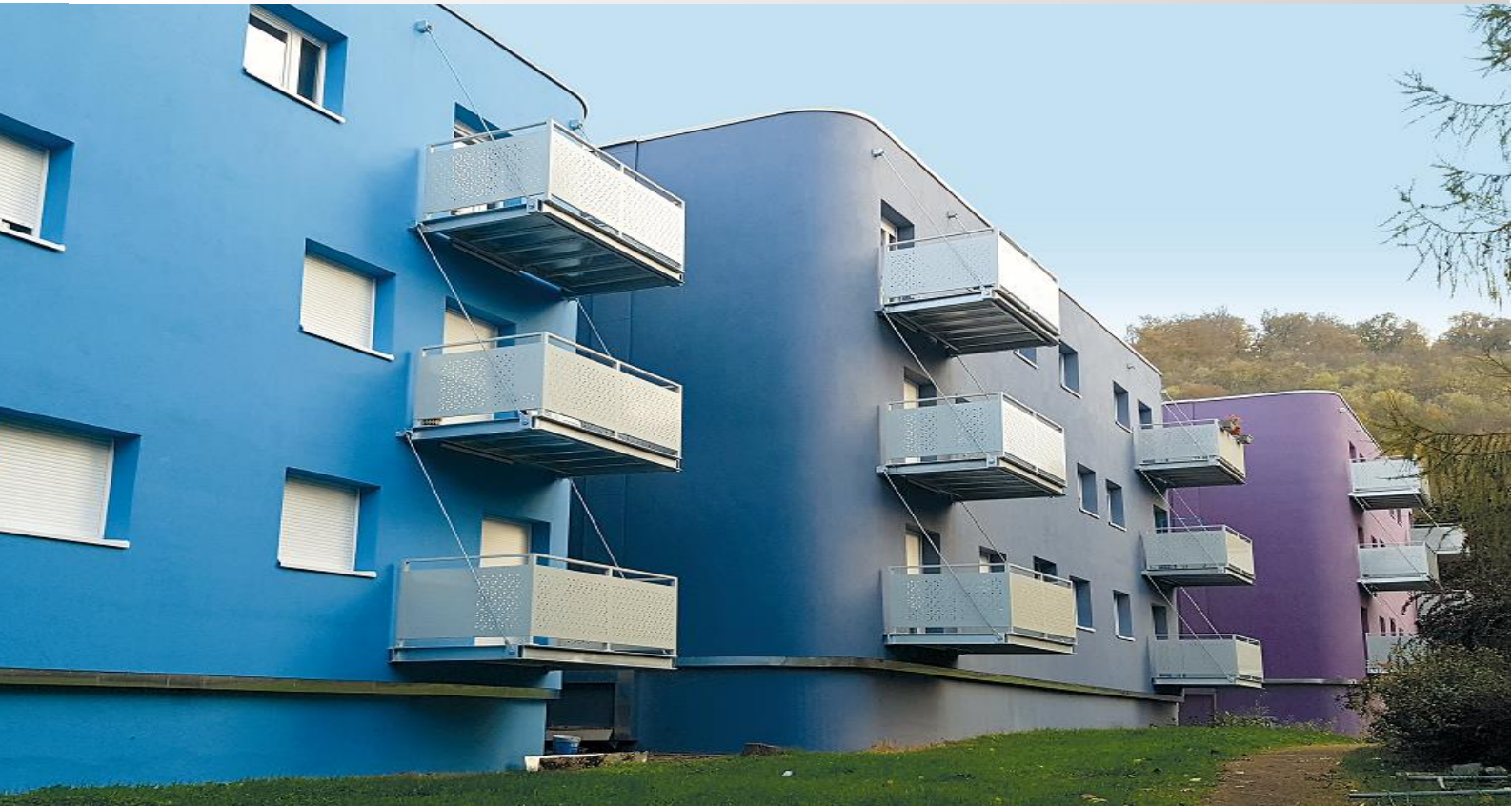
Cité du Wiesberg - Solutions Sto : StoTherm Vario / PSE cintré StoSilco K / StoColor X-black, Maître d'ouvrage : SNI Ste-Barbe, Oberhausbergen (67), Réhabilitation : Atelier Choiseul (75), Architecture originale de Emile Aillaud, mise en couleur par l'artiste Fabio Rieti

| Façade | Isolation Thermique par l'Extérieur |