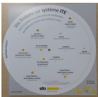
La roue des choix