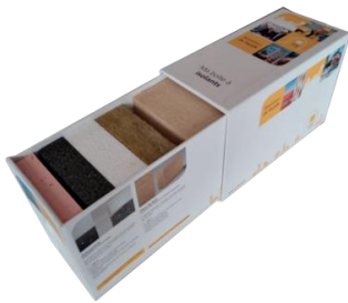
La boîte à isolants