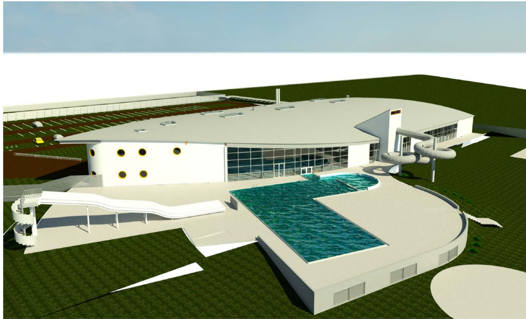
1 PERSPECTIVE BASSIN EXTERIEUR 25 m 1 : 1