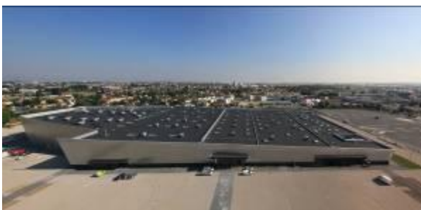
Le Capitole en Champagne à Châlons-en-Champagne (51) – MOA : Genecomi – MOE : Chabanne et Partenaires