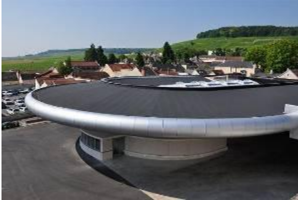
Union Champagne à Avize (51) – MOA : Union Champagne – MOE : Vincent Fierfort

SOPREMA ENTREPRISES, branche « travaux » du groupe familial SOPREMA, s'affirme aujourd'hui comme leader et précurseur des applications liées à l'enveloppe des bâtiments : étanchéité des toitures-terrasses, couverture, bardage et désenfumage.