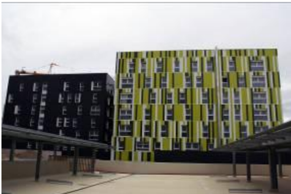
Résidence St John Perse à Reims (51) – MOA : Reims Habitat – MOE : Jean-Philippe Thomas