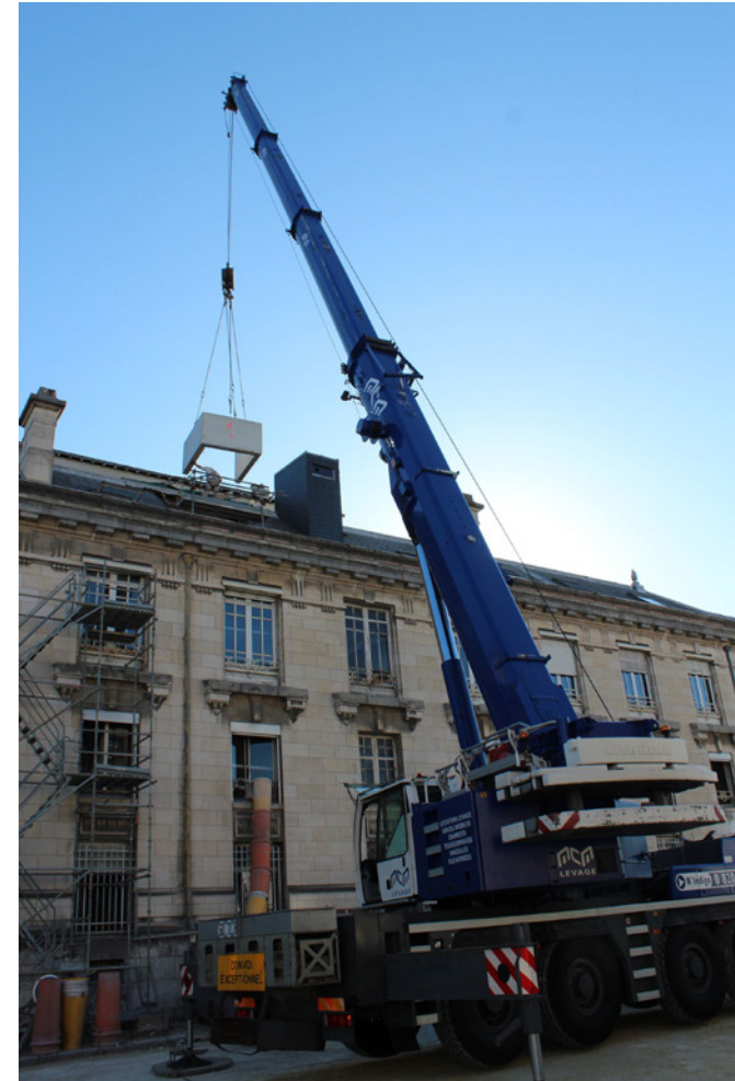
pose cage ascenseur

(source : étude clients - cabinet Ducker)