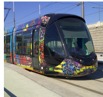
Tramway de Montpellier