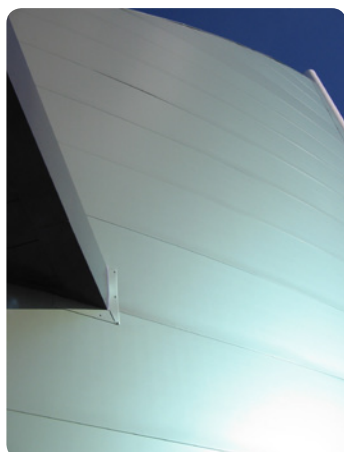
Pearl 60 - coloris Apple Perla 1611 Intermarché de Vaux sur Mer (17) Architecte : Espace Engineering

Au total, ce sont plus de 100 teintes qui sont disponibles. Et pour aider les architectes dans leur choix, des échantillons témoins sur acier prélaqué au format A4 peuvent être fournis sur demande. Arval offre également la possibilité de créer des couleurs « sur mesure » (sous réserve de quantité suffisante).