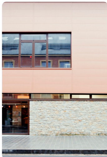
Authentic 35 - coloris Cuppra 5216

Bowling à Charleville Maizières (08) Architecte : Suan & Associés