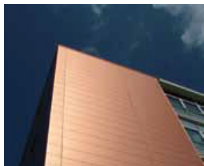
Bâtiment : Bureaux St Serge Architecte : Frederic ROLLAND