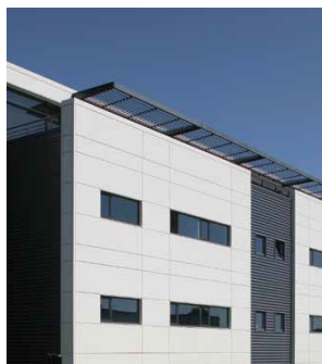
Bâtiment : Dynamia Architecte : Philippe COGMARD

Le revêtement Hairclyn est disponible en option sur de nombreux coloris du nuancier « Colorissime » d'Arval tout en conservant les propriétés techniques de chacun des revêtements organiques. Hairclyn est proposé dans des gammes de revêtements classiques HAIRPLUS ou d'exception telles que :