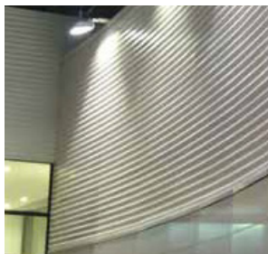
Bâtiment : Intermarché Lamballe Architecte : Yafi DOUTS

Baptisée « Hairclyn », la nouvelle technique de revêtement développée par Arval permet de conserver l'état des façades grâce à un combiné technologique reposant sur un principe de revêtement déposé sous vide PVD (Physical Vacuum Deposition), appliqué en continu et contenant du Dioxyde de Titane qui confère à la surface ses propriétés hydrophiles. Cette technologie est déjà connue dans le métier du verre est pour la première fois utilisé pour les façades en acier prélaqué. Une révolution technique pour un revêtement acier qui permet à Arval d'apporter à ses clients prescripteurs une solution à très haute valeur ajoutée répondant parfaitement aux exigences d'image des bâtiments commerciaux.