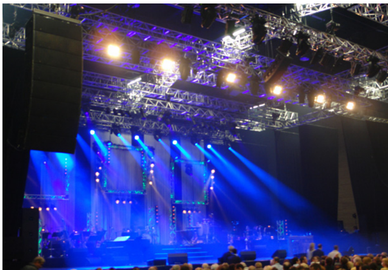
La salle de spectacles flambant neuve a eu un invité de choix : Laurent Gerra et son orchestre de 19 musiciens.