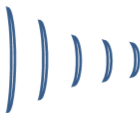
Portée sans fil : 10 m