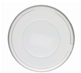
Emetteur dans l'ambiance

DAIKIN annonce également le lancement de nouvelles sondes déportées à ondes radio K.RSS . Afin de s'assurer de l'homogénéité de la température dans une pièce, il est parfois nécessaire de poser une sonde de température déportée.