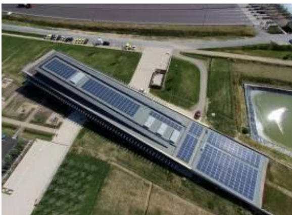
L'Ecopole de la Sanef à Reims (51) – MOA : Sanef – MOE : Grzeszczak et Rigaud Architectes

SOPREMA ENTREPRISES, branche « travaux » du groupe familial SOPREMA, s'affirme aujourd'hui comme leader et précurseur des applications liées à l'enveloppe des bâtiments : étanchéité des toitures-terrasses, couverture, bardage et désenfumage.