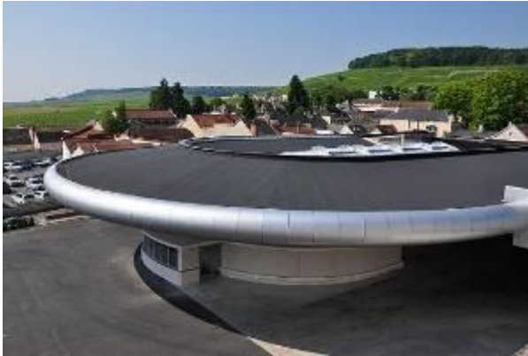
Union Champagne à Avize (51) – MOA : Union Champagne – MOE : Vincent Fierfort