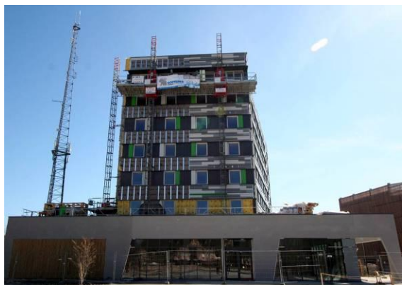
Mise en œuvre des façades