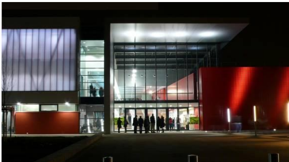
COSEC - Salle des sports - Crédit photo : Soprema Entreprises