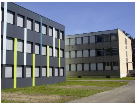
Collège Stockfeld

SOPREMA ENTREPRISES, branche « travaux » du groupe familial SOPREMA, s'affirme aujourd'hui comme leader et précurseur des applications liées à l'enveloppe des bâtiments : étanchéité des toitures-terrasses, couverture, bardage et désenfumage.