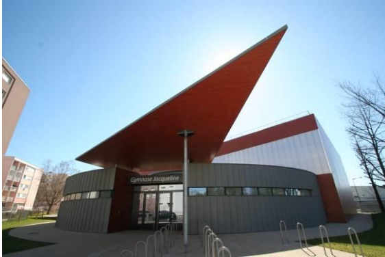
Gymnase Jacqueline