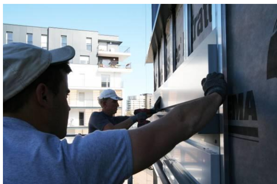
Mise en œuvre de la façade