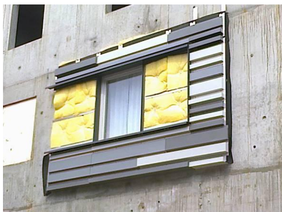
Prototype du bloc - Crédit photo : Soprema Entreprises