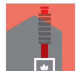
Le kit d'adaptation pour le conduit de cheminée traditionnel maçonné existant