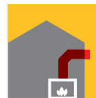
Le conduit horizontal avec sortie murale