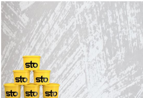
Catalogue des formations Chantier Ecole 2018 ITE - Ravalement - Finitions

Dans le contexte économique et environnemental actuel, les métiers de la façade connaissent des évolutions tant sur le plan réglementaire que sur les systèmes de plus en plus variés. A la demande de ses partenaires (applicateurs professionnels de la façade, maîtres d'ouvrage, maîtres d'œuvre, bureaux de contrôle), Sto les accompagne dans l'adaptation de leurs métiers à travers son Centre de formation depuis 2009. Dans cette démarche, Sto fournit une offre de formations au service de la transmission, du renouvellement et de la création de compétences.