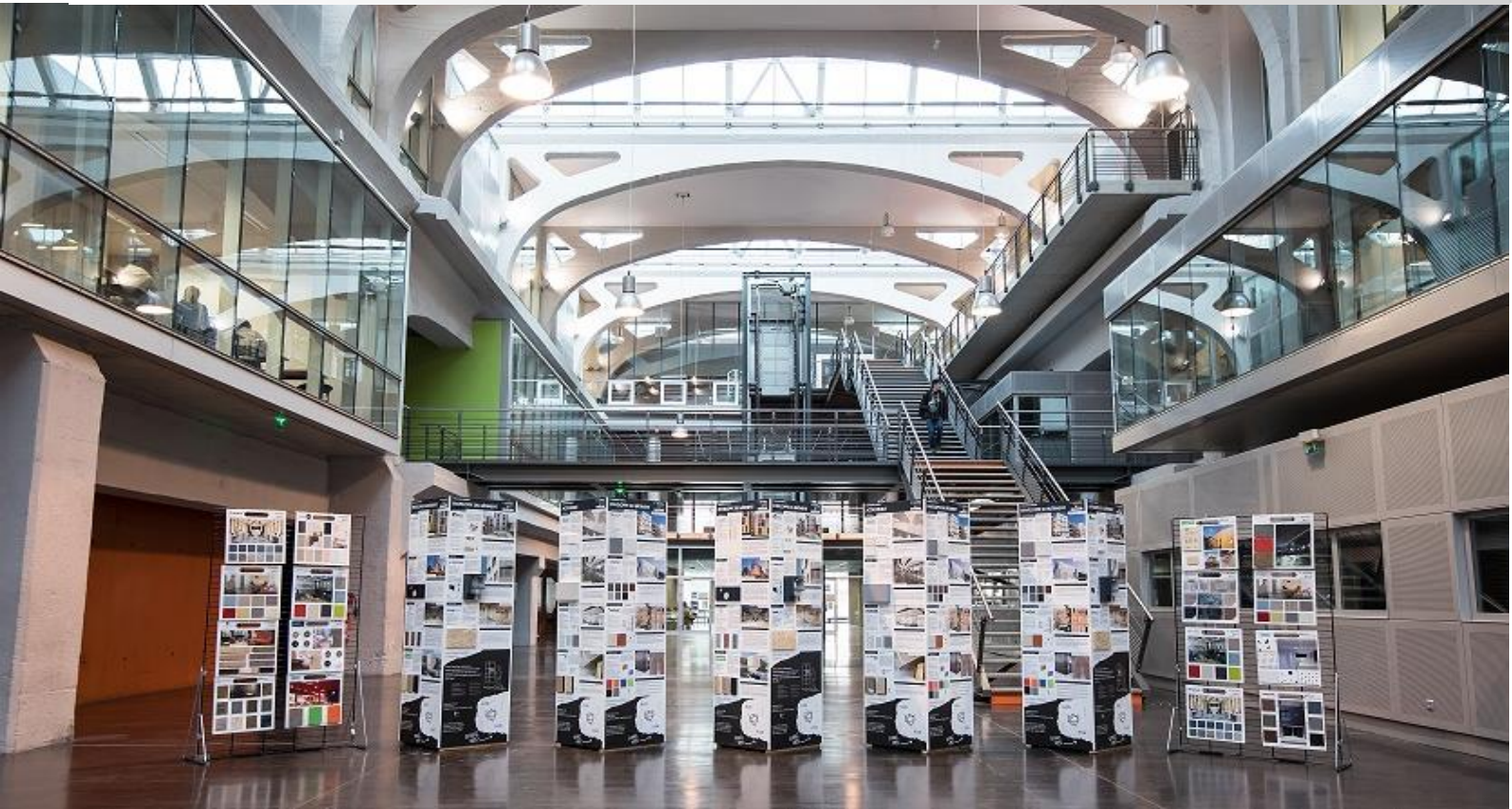
Echantillons Sto (panneau mural de 405x105 mm) référencés sur la Matériauthèque Campus

| Façade | Isolation Thermique par l'Extérieur | Ravalement