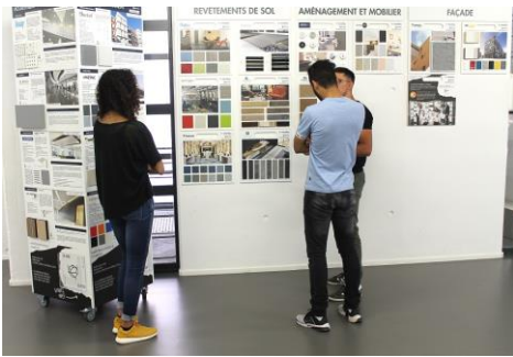
Etudiants devant la Matériauthèque ENSA Strasbourg