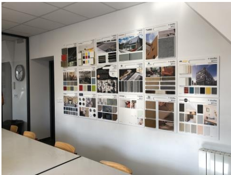
Panneau en salle de réunion. Rennes