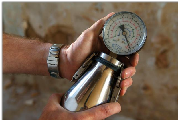
Bombe à carbure pour déterminer la teneur en eau d'un mur

Celle-ci est déterminée en prélevant un échantillon du mur et en le faisant réagir avec le carbure de calcium.