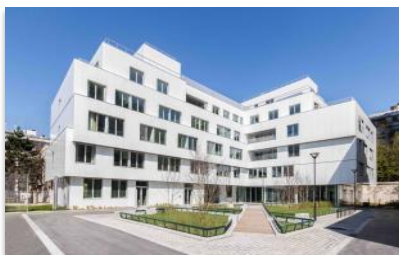
EHPAD rue de Lourmel à Paris 15 ème Première réalisation avec des panneaux StoVentec Glass de 4,50 mètres. Maître d'ouvrage : SEM PariSeine Architecte : Trevelo & Viger-Kohler

La façade ventilée StoVentec Glass est composée d'un panneau composite, d'une isolation thermique par l'extérieur et d'une structure porteuse aluminium-acier inoxydable. Elle peut être aussi mise en œuvre sans isolant à titre décoratif.