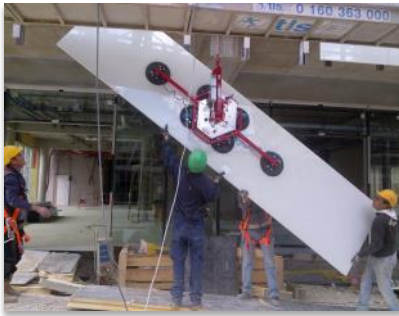
EHPAD rue de Lourmel à Paris 15 ème Les panneaux de 4,50 mètres ont été mis en œuvre avec des palonniers à ventouses.