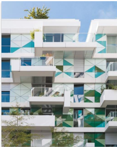
Projet UNIK, ZAC Seguin à Boulogne-Billancourt (92) Plusieurs triangles en verre de couleurs différentes ont été collés sur une même plaque support. Maître d'ouvrage : Nexity Architecte : Beckmann N'Thépé

Les panneaux les plus hauts ont été réalisés sur un EHPAD rue de Lourmel dans le 15 ème arrondissement de Paris. Sur ce bâtiment, des panneaux de 4,50 mètres ont été posés. La mise en œuvre a été effectuée à l'aide de palonniers à ventouses : ce moyen de manutention était incontournable pour une mise en œuvre réussie. Le résultat final présente une façade blanche, pure, grâce à la finition 9016 extra clair, selon le souhait de l'architecte du cabinet TVK.