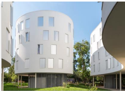
Afin d'insérer le projet dans son environnement, les architectes ont réparti les logements dans quatre bâtiments aux multiples courbes et aux toitures végétalisées, reposant sur des pilotis.