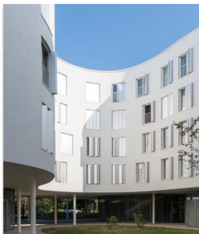
L'enduit de finition taloché à grain fin Stolit K1 blanc ivoire offre la surface lisse attendue par les architectes pour mettre en évidence la géométrie des bâtiments.