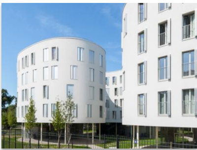
La résidence de logements sociaux située au 45-47 avenue du Maréchal Fayolle, à Paris 16 ème , a été inaugurée en octobre 2018.

A Paris, en lisière du Bois de Boulogne, quatre immeubles abritant une centaine de logements sociaux jouent la transparence et la légèreté grâce à des façades aux multiples courbes. Un effet réussi grâce au système de bardage à enduire StoVentec R appliqué sur un mur-rideau à ossature bois.