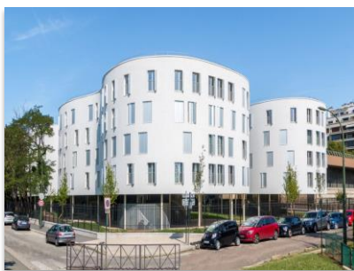
L'orientation des bâtiments permet d'offrir, depuis un même logement, des angles de vue variés vers les avenues, le Bois de Boulogne et le cœur d'îlot.

Inaugurée en octobre 2018, la résidence de logements sociaux située au 45-47 avenue du Maréchal Fayolle, à Paris 16 ème , aura connu bien des vicissitudes avant d'accueillir ses premiers locataires. Une première demande de permis de construire est déposée par le bailleur social Paris-Habitat en 2009 pour la construction de 135 logements répartis dans quatre immeubles R+5. Le permis est attaqué par plusieurs recours de la part de riverains et d'associations qui voient d'un mauvais œil l'arrivée de logements sociaux dans ce quartier chic à l'orée du Bois de Boulogne. Paris-Habitat revoit son programme à la baisse et supprime un étage sur chacun des quatre bâtiments, pour obtenir un total de 100 logements. Après sept ans de procédure, les travaux de construction démarrent enfin en novembre 2016 pour une durée de deux ans.