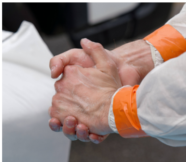
Lavage de mains