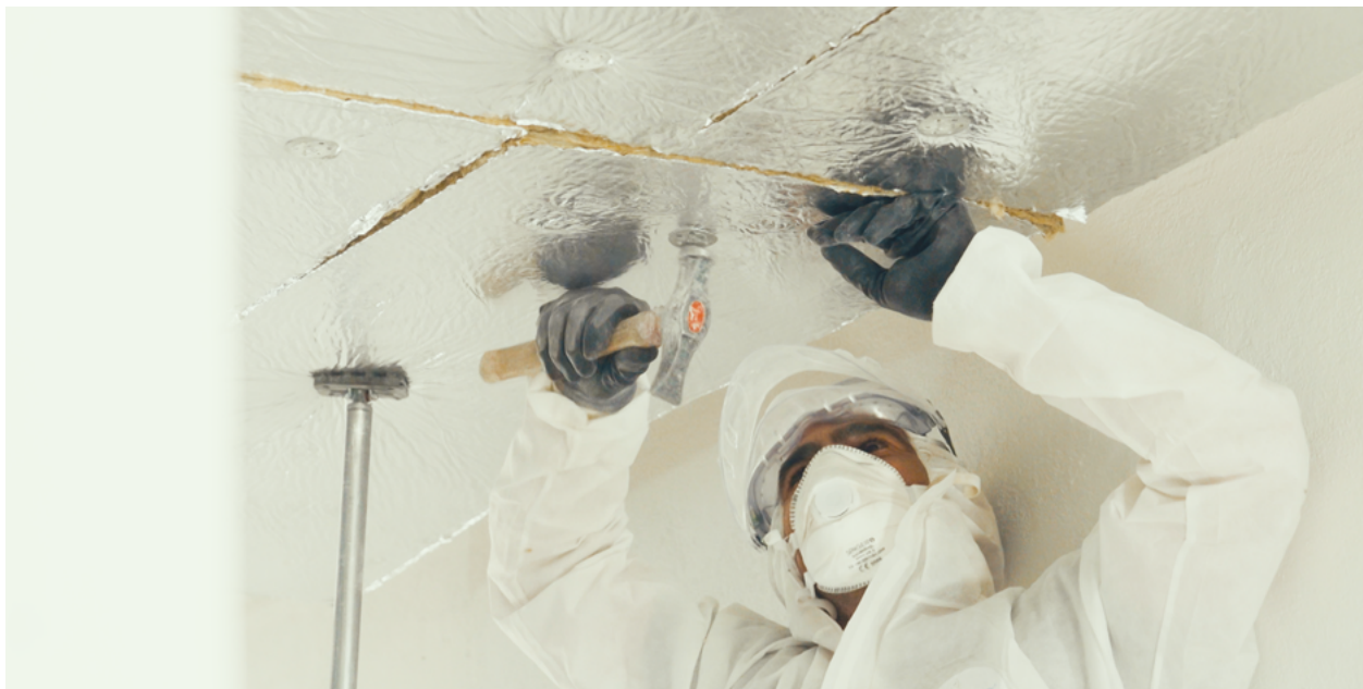
Isolation des planchers-bas d'une copropriété à Vitrolles.

« Nous essayons de redémarrer le maximum de chantiers mais il y a encore des réticences de la part de nos clients », constate Eric Richart.