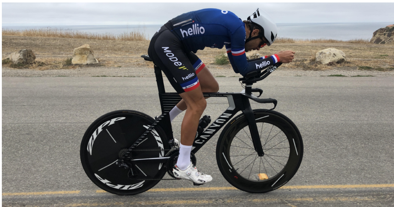
Evens Stievenart champion des 24h du Mans et recordman de la Race Across America