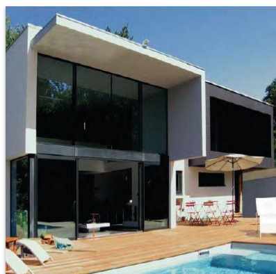
« Villa Carnet » Basse Consommation, Thonon (74).

En termes de finition, Sto propose de très nombreuses possibilités combinables entre elles : enduits, plaquettes de parement en terre cuite, enduit préfabriqué sur-mesure... et offre plus de 800 teintes du pastel aux couleurs vives.