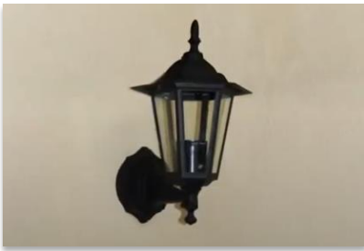
Eclairage extérieur fixé avec StoFix Iso-Dart

Avec Sto-Fix Iso-Dart, il n'y a pas de compromis entre productivité sur le chantier et sécurité du système d'isolation de façade par l'extérieur !