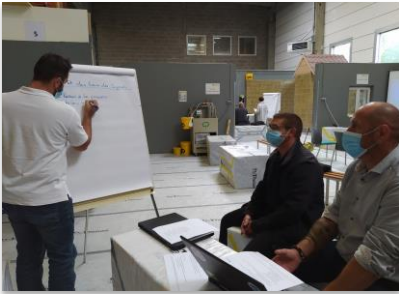
Les formations continuent, dans le respect du protocole sanitaire mis en place.

individuelle (lunette, bouchons d'oreilles, casque, gants, masques en quantité suffisante pour être changés par demi-journée) et les gestes barrières sont de rigueur.