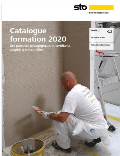
Catalogue formation 2020