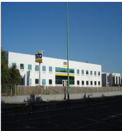
Le centre de formation de Sto situé au sein de son siège social à Bezons (95)

Situé au sein de son siège social à Bezons (95), le centre de formation de Sto entend soutenir ses partenaires en mettant à leur disposition toutes les clés pratiques et théoriques pour faire monter leurs équipes en compétences. Mais Covid-19 oblige, les formations ont été mises en stand-by pendant plusieurs mois. Distanciation sociale, masques obligatoires, adaptation de la capacité d'accueil... Sto a mis en place un protocole sanitaire strict pour reprendre les formations en septembre 2020... Et les poursuivre pendant ce deuxième confinement face à la forte demande !