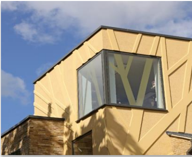
Théâtre des Arts Tara, Londres (Royaume-Uni)

Exemple de graphisme en relief réalisé en StoDeco