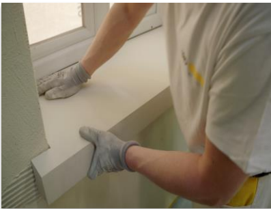
Mise en œuvre d'un appui de fenêtre

Exemple de graphisme en relief réalisé en StoDeco