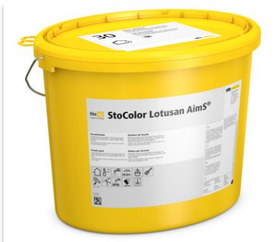
Peinture StoColor Lotusan AimS®