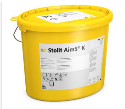
Enduit de finition StoLit AimS®