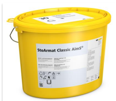
Sous-enduit StoArmat Classic AimS®