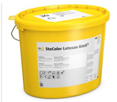
Peinture StoColor Lotusan AimS®