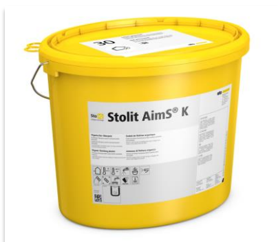
Enduit de finition Stolit AimS®