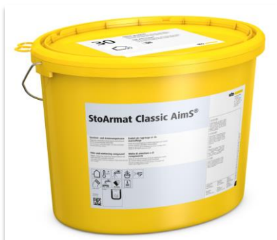
Sous-enduit StoArmat Classic AimS®

StoArmat Classic AimS® est un sous-enduit organique et sans ciment fabriqué à partir de matières premières renouvelables et suffisamment disponibles. Il associe le respect de l'environnement à d'excellentes propriétés de mise en œuvre et de lissage.