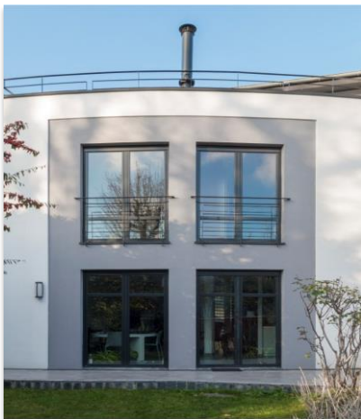
Une belle façade ça s'entretient !

Les façades sont soumises à rude épreuve : la pollution, les conditions météo mais aussi la prolifération d'organismes vivants comme les algues ou les mousses peuvent altérer leur esthétique. Sto, le spécialiste de la façade - isolation thermique par l'extérieur (ITE), produits techniques et d'embellissement des façades, bardage ventilé - recommande d'entretenir régulièrement sa façade afin de préserver son aspect esthétique durablement. Un entretien régulier, c'est aussi éviter de devoir recourir à des travaux plus lourds, et donc plus coûteux.