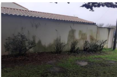
Exemple d'une façade encrassée

Si le logement se trouve dans une zone urbaine , des facteurs tels que la pollution et les gaz d'échappement, provoqueront un encrassement, dit atmosphérique, plutôt gras . Des salissures sombres, qui ternissent la façade (souvent de la suie, de la poussière ou du noir de carbone), apparaissent. Pour retrouver l'aspect originel de la façade, ce type d'encrassement gras nécessite des produits avec un traitement approprié, comme le Sto-Nettoyant Façades AB , spécialement conçu pour les supports peints, ou le Sto-Nettoyant Universel pour les supports bruts, comme la pierre ou la brique, afin de venir à bout de ces défauts esthétiques.