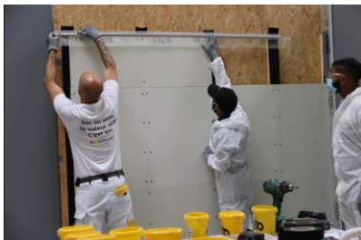
La formation « Chantier école Bardage »

La formation « Chantier école ITE enduit mince sur isolant » caracole toujours en tête et ne désemplit pas ! Ce module a largement fait ses preuves puisque 100 % des apprenants le recommandent, selon l'enquête de satisfaction réalisée par Sto de fin de session. Cette formation va généralement du compagnon jusqu'aux dirigeants d'entreprises, en passant par de plus en plus de commerciaux en quête d'arguments de vente. Dispensée sur 2 jours, elle porte sur l'apprentissage de la pose d'un système d'enduit mince sur isolant, jusqu'à l'application de l'enduit de finition, en passant par le traitement des points singuliers (encadrement de fenêtre). L'ITE sous enduit mince représente 70 % du marché de l'isolation, selon les chiffres évoqués durant les sessions, notamment pour son rapport qualité/prix, sa variété de finitions, mais aussi sa résistance aux chocs.