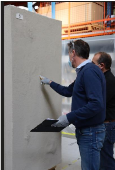
La formation sur les pathologies de façade et les solutions de ravalement