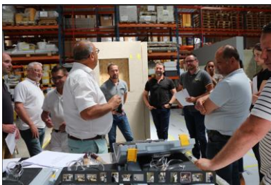
La plateforme de formation de Sto est située au sein de son siège social à Bezons (95).

Face à une filière métier en mutation, Sto forme et accompagne de plus en plus d'entreprises et de compagnons dans son centre de formation et d'animation de Bezons (95). L'an dernier, le fabricant de systèmes d'isolation thermique par l'extérieur et spécialiste de l'embellissement de façade, proposait deux nouvelles formations qui ont trouvé un écho favorable auprès des professionnels. En 2023, pas de changement dans le catalogue, les formations restent les mêmes, les clients n'ayant pas exprimé de nouveaux besoins. Certifié Qualiopi, Sto met tout en œuvre pour que ses clients bénéficient de formations de qualité, dans un contexte où la rénovation énergétique n'a jamais été autant d'actualité.