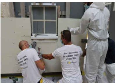
Apprentissage du geste accompagné par les Techniciens d'application Sto

Toutes les dates de formation et l'intégralité des parcours sont à retrouver sur sto.fr / Rubrique formation.