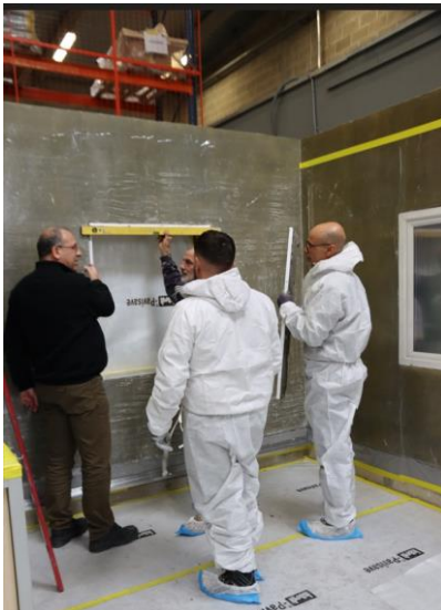
La formation « Chantier école ITE enduit mince »