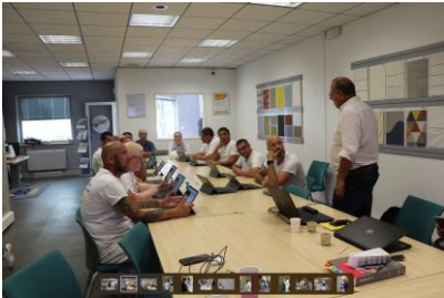
Des formations qui mixent théorie et pratique.

par l'organisme Qualibat, Sto participe à la montée en compétences des entreprises et contribue ainsi à les aider à obtenir cette précieuse qualification.