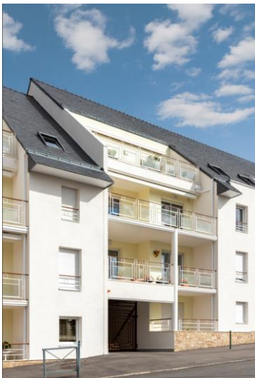
Résidence Nautilus à Carquefou (44) Pluies et vents d'ouest : pour les habitants de la résidence Nautilus à Carquefou (44), la protection aux intempéries est une priorité.

Pour protéger cette résidence de 35 logements des dommages liés aux pluies et vents d'ouest, une solution d'étanchéité continue entre balcons et façades a été retenue, intégrant le système d'imperméabilité taloché Irtop S K de classe I3 de Sto.