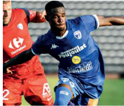
Partenaire des Chamois Niortais depuis 1998 (Ligue 2)

Le Groupe Poujoulat s'engage également dans les territoires où il est présent par la voie de sponsoring et de mécénat en soutenant l'éducation, le sport, la culture, la biodiversité et des actions caritatives.