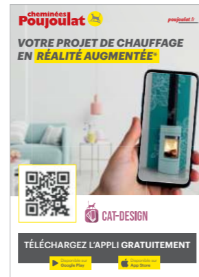
Cat-Design Configurateur en ligne pour préparer son projet de chauffage

L'entreprise est ainsi réactive aux demandes et aux questions des consommateurs qui peuvent compter sur la marque.