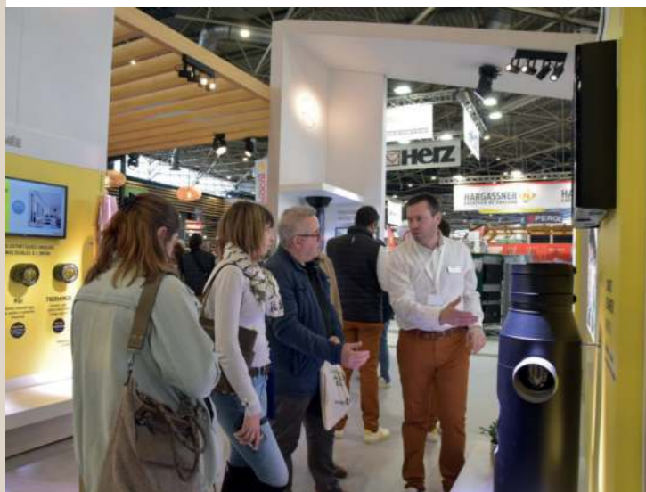
Salon BePositive - Mars 2023

Le groupe porte également une grande attention à la qualité de son service clients . Il mobilise l'ensemble de ses services (marketing, administration des ventes, service après-vente, bureau d'études, force de vente, exploitation, logistique & export) afin d'apporter une information complète et détaillée au consommateur final sur des sujets tels que : l'habitat, l'énergie et l'innovation.