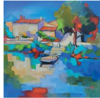
Partenaire du Festival International de Peinture de Magné depuis 2004