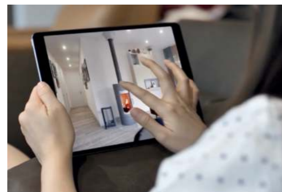
Campagne TV france•2 france•3