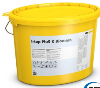
Irtop PluS Biomass : la 1 ère gamme de revêtements d'imperméabilité issue de la biomasse certifiée REDcert 2