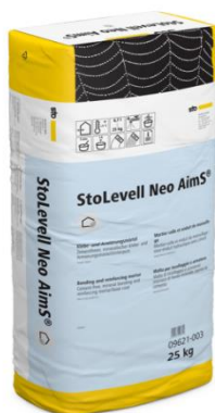
Nouveau sous-enduit d'ITE StoLevel Neo AimS®