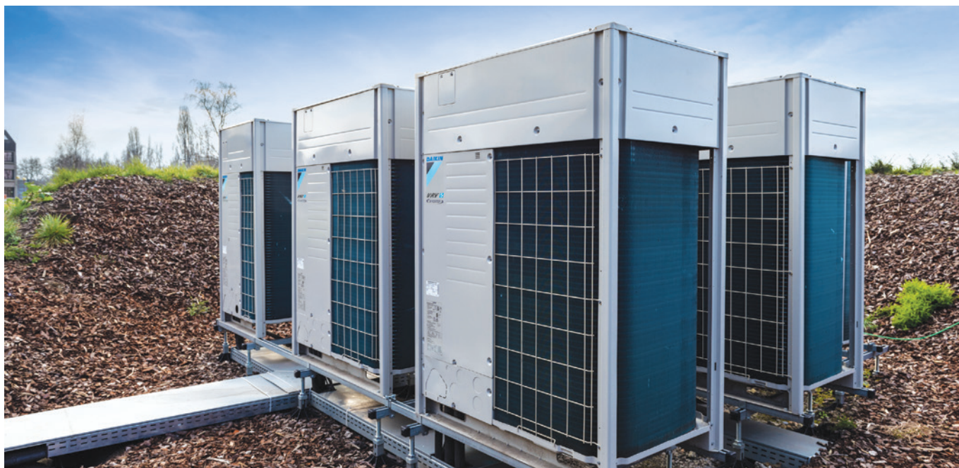
Sur Chillventa 2024, Daikin Europe N.V. a partagé sa vision quant à l'application de la révision F-Gaz sur la réduction progressive des HFC, tout en poursuivant le déploiement essentiel de pompes à chaleur plus accessibles, économes en énergie et sûres.