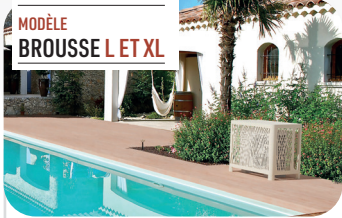
MODÈLE BROUSSE L ET XL

Ces deux nouveaux modèles grands formats permettent d'habiller des climatisations et pompes à chaleur plus volumineuses.