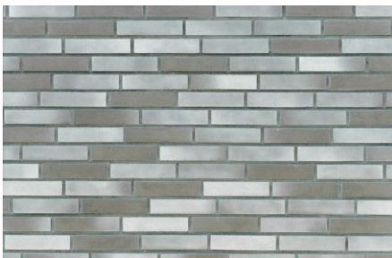
80 références pour satisfaire toutes les demandes esthétiques

Disponibles en 6 formats spécifiques à chaque procédé, dont de nouvelles tailles plus longues et plus étroites, les plaquettes de parement StoBrick démultiplient le potentiel esthétique pour concevoir une façade personnalisée, grâce à sa gamme très étendue qui va des surfaces finement texturées ou lisses et mates aux aspects poreux, bruts et rustiques.