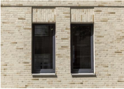
Référence : Greifswalderstraße/Hambourg, DE

L'appareillage des plaquettes permet d'obtenir des effets très variés. Certains reprennent des traditions de pose « à l'ancienne », d'autres accentuent au contraire la linéarité et la modernité du parement.