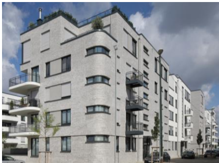
Référence : Bâtiments résidentiels Grafental WA 5/Düsseldorf, DE

Sous avis technique, le système complet intègre le sous-enduit StoLevell Uni, le mastic pour la réalisation des joints de fractionnement, ainsi que la nouvelle colle StoColl KM Plus.