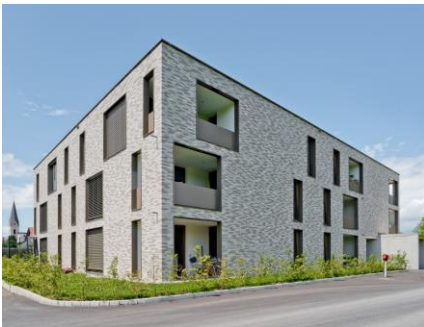
Référence : Bâtiment résidentiel Gerberweg/Lauterach, AT