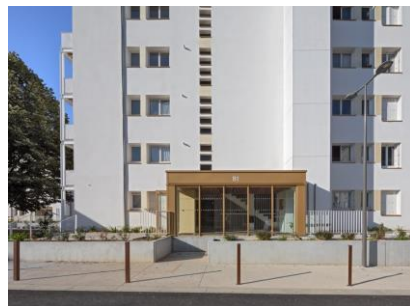
Résidence Lot Habitat Terre-Rouge, Cahors (46)