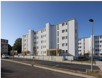
Résidence Lot Habitat Terre-Rouge, Cahors (46)

Initiée par le bailleur Lot Habitat, la réhabilitation de 72 logements sociaux a inclus la reprise de l'enveloppe des bâtiments, et la création de halls plus vastes et lumineux. Réalisé avec le système StoTherm Mineral 1 de Sto, le traitement de la façade contribue au confort thermique tout en donnant à la résidence une identité plus moderne.