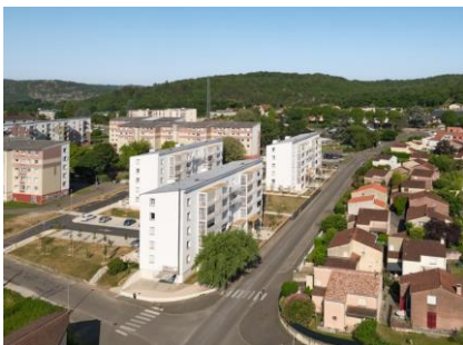
Résidence Lot Habitat Terre-Rouge, Cahors (46)