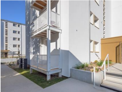
Résidence Lot Habitat Terre-Rouge, Cahors (46)