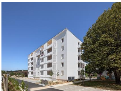
Résidence Lot Habitat Terre-Rouge, Cahors (46)