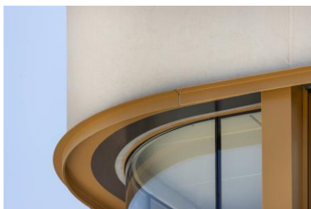
Trophée « Un avenir responsable » Artib / Ameller Dubois / Scoping

manuellement avec précaution afin d'éviter toute fissuration. Les sous-enduits ont quant à eux été appliqués à la règle de maçon, selon une méthode artisanale garantissant un rendu homogène et soigné.