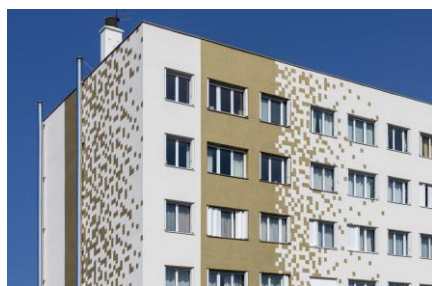
Trophée « L'art de la façade » Reanova

Lauréate dans la catégorie « Un avenir responsable », le maître d'œuvre Reanova a été récompensée pour la rénovation globale d'une copropriété de 51 logements située à Vanves (92). Ce projet ambitieux a porté sur l'ensemble des composantes du bâti, avec pour objectif un gain énergétique de 42 % : remplacement des menuiseries, réfection de la toiture, amélioration de la ventilation et du chauffage, ainsi que la rénovation complète des façades. Au total, 2 700 m 2 d'ITE ont été mis en œuvre, associant les systèmes StoTherm Mineral (laine de roche) et StoTherm Resol (mousse résolique).