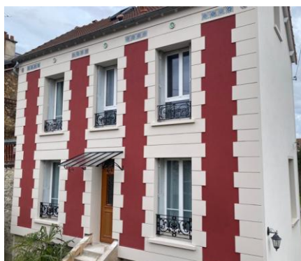
Trophée « Maison signature » : Frontis Isolation (Photo après rénovation)

Basée à Champigny-sur-Marne, dans le Val-de-Marne (94), Frontis Isolation est une entreprise spécialisée dans l'isolation, la pose de menuiseries performantes et les travaux de ravalement. Partenaire fidèle de Sto depuis près de dix ans, elle s'est vu décerner le trophée de la « Maison signature » pour un projet remarquable de rénovation thermique par l'extérieur.