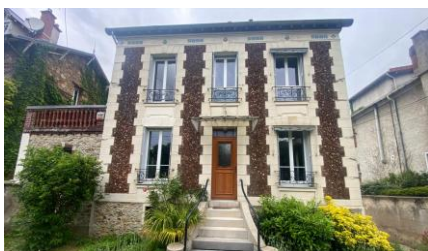
Trophée « Maison signature » : Frontis Isolation (Photo avant rénovation)

L'entreprise a relevé le défi d'isoler une maison en meulière, tout en préservant son caractère architectural. Grâce au système de modénatures StoDeco Frame, l'ensemble des éléments décoratifs d'origine a été recréé avec précision, y compris les décors en céramique, restaurés ou reproduits à l'identique. Ce projet, respectueux du patrimoine et parfaitement intégré à son environnement, a reçu l'aval des Architectes des Bâtiments de France.