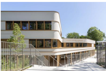
Trophée « Un avenir responsable » Artib / Ameller Dubois / Scoping

L'entreprise Artib, l'agence d'architecture Ameller Dubois, ainsi que le cabinet d'économistes en bâtiment Scoping, ont été récompensés par le trophée « L'Art de la Façade » pour la réalisation exemplaire de l'enveloppe du collège Claudine Hermann à Massy (91). Le défi : mettre en œuvre une isolation thermique par l'extérieur tout en respectant les courbes fluides et l'esthétique singulière du bâtiment.