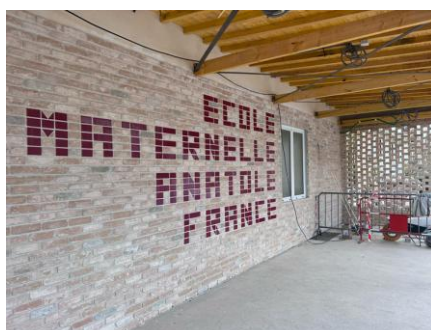
Trophée « Coup de cœur du jury » MB Peinture