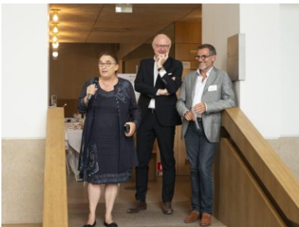
Remise des « trophées 50 ans Sto » à l'Ecole du Louvre de Paris le 25 juin 2025