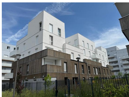
Trophée « Coup de cœur du jury » Samed Façades

« Le travail esthétique est remarquable. L'ITE StoTherm Brick en laine de roche, associée aux plaquettes émaillées qui dessinent le nom du groupe scolaire, donne une vraie identité au bâtiment. Il y a eu un souci du détail et un changement d'image très réussi. »