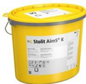
Enduit de finition Stolit AimS® avec nouveau sceau à base de plastique recyclé