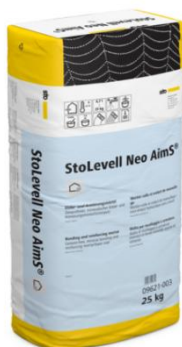
Nouveau sous-enduit d'ITE StoLevell Neo AimS®