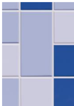
Nouvelle finition en céramique StoCera