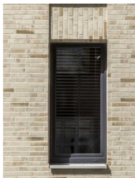
Nouvelle finition en terre cuite StoBrick