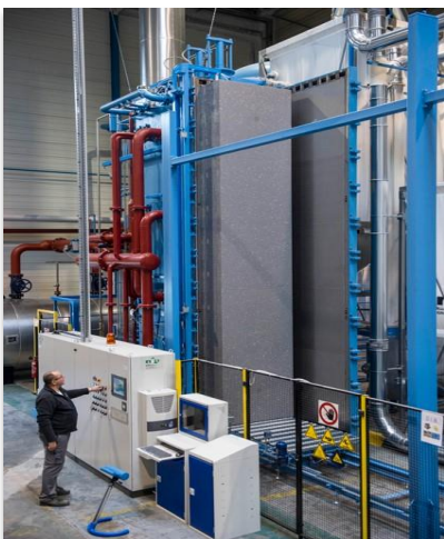
Moulage des blocs PSE

Une nouvelle version de Fiche de Déclaration Environnementale et Sanitaire (FDES) des panneaux polystyrène fabriqués à Innolation est prévue dans les prochains mois, afin d'intégrer ce process industriel optimisé en matière de préservation des ressources.