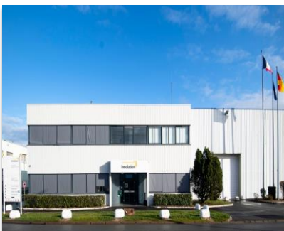
Usine Innolation à Amilly (45) dédiée à la fabrication de panneaux PSE