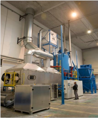
Pré-expansion des billes à la vapeur d'eau