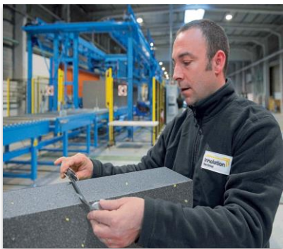
Sto-Panneau Isolant graphité Top31 fabriqué à Amilly