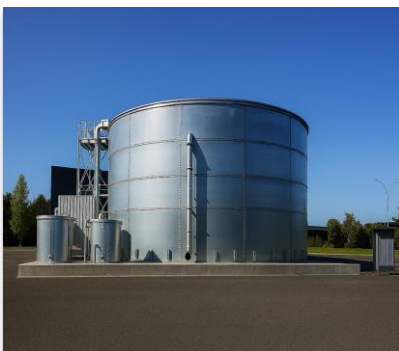
Nouveau système de récupération des eaux de pluie

L'objectif-cible inscrit dans l'arrêté d'exploitation est de réduire de 80 % la consommation d'eau de ville (eau potable), soit un volume annuel de référence de 10 000 m 3 d'eau potable économisés (environ 4 piscines olympiques). Le projet, d'un montant de 1,125 M€, a bénéficié du concours financier de l'Agence de l'Eau Seine-Normandie, à hauteur de 40 %.